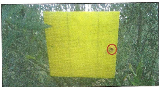
Panneau chromatique jaune avec capsule à phéromones sexuelles (entourée en rouge).

Le panneau chromatique jaune avec capsule à phéromones sexuelles cumule l'attraction par la couleur jaune et l'attraction sexuelle. Très facile d'emploi, il se change tous les mois.