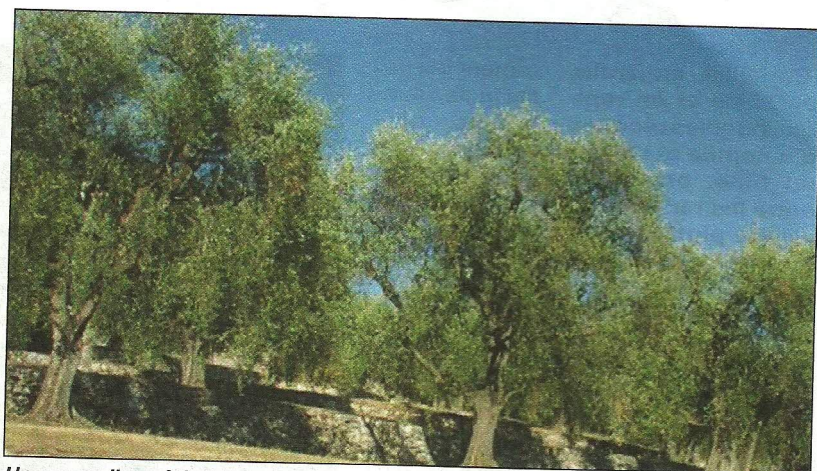
Une nouvelle spécialité permet d'alterner les traitements contre la mouche de l'olive.

Jusqu'à présent, les producteurs disposaient d'appâts attractifs en traitements localisés (Synéis appâts), de pyrethinoïdes (plutôt utilisés en traitement préventif fin juin début juillet) et du diméthoate positionné en traitement larvicide. L'autorisation de la spécialité Calypso (480 g/l de thiaclopride) apporte une nouvelle solution larvicide à positionner au pic de vol plutôt en fin de saison (septembre/octobre) compte tenu de son